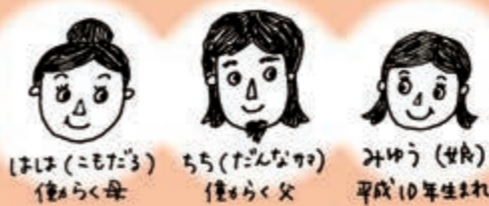
こもだる(狐樽)とは藁(わら)の狐(こも)でくんだ酒樽のこと。お酒を愛しすぎて自分のあだ名にしてしまいました。