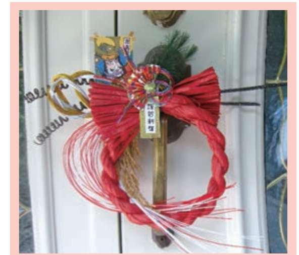
飾りつけは28日までに。取り払うのはだいたい 7日・11日・15日に。

材料のパーツはフラワーショップやホーム センターなどで買うことが出来ます。 飾りつけは、ルールにとらわれず神々も思 わず目を留めてしまうようなインパクトを 大切にしてみてください。