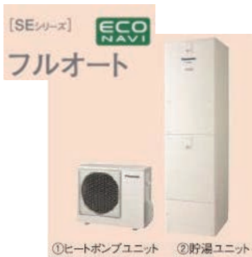
①ヒートポンプユニット ②貯湯ユニット