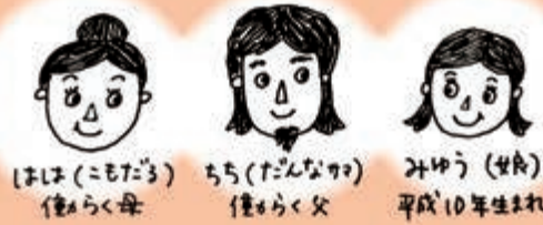
こもだる(孤樽)とは藁(わら)の孤(こも)でくるんだ酒樽のこと。 お酒を愛しすぎて自分のあだ名にしてしまいました。