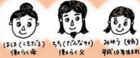
こもだる(菰樽)とは菰(わら)の菰(こも)でくるとんだ酒樽のこと。お酒を愛しすぎて自分のあだ名にしてしまいました。