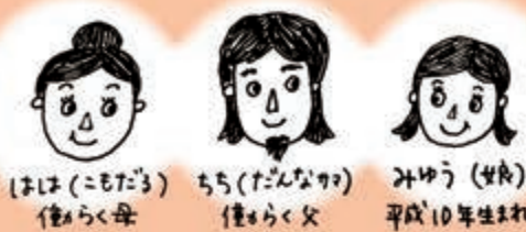
はは(こもだる) ちち(だるな) みゆ(娘) 働らく母 働らく父 平成10年生まれ

こもだる(狐樽)とは藁(わら)の狐(こも)でくるんだ酒樽のこと。お酒を愛しすぎて自分のあだ名にしてしまいました。