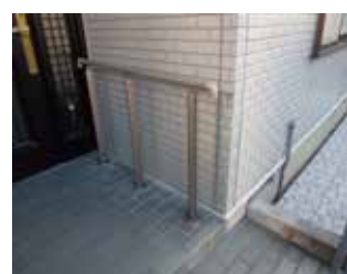
アプローチにスロープと手摺を設置