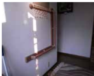
玄関ホールに手摺を設置