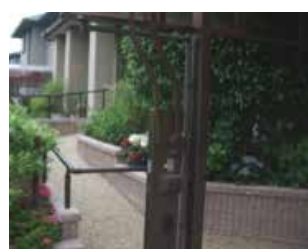
勝手口通路にスロープと手摺を設置