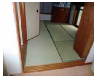
和室入口の段差を解消