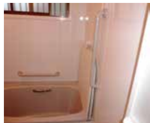
浴室に手摺を設置