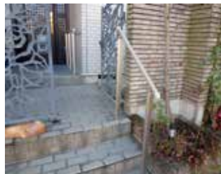
玄関前に手摺を設置