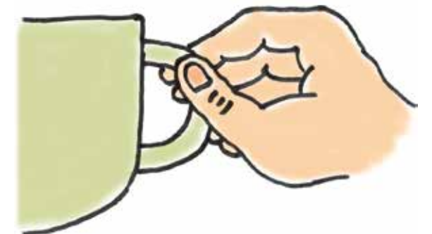
指の先でつかんだ感覚