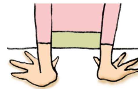
ひじは伸びていますか？