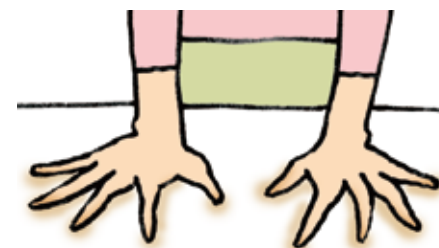
薬指と中指の間は、ちゃんと開いていますか？