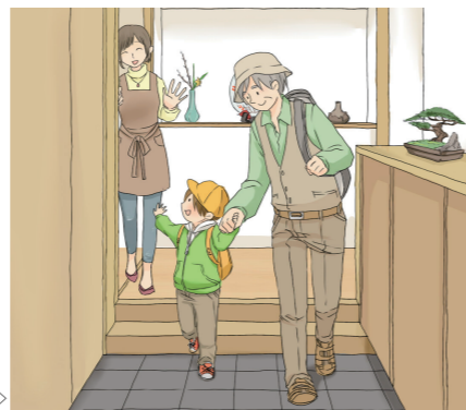
玄関を一緒に使う⇨