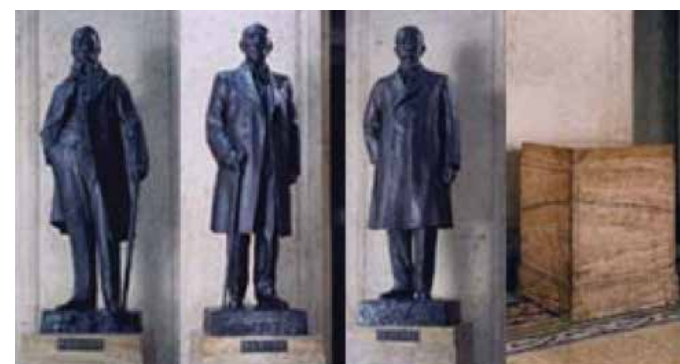
■伊藤博文 ■板垣退助 ■大隈重信

しかし、ここで疑問が残ります。四隅に台座があり、そのうちの3つには銅像があるのに、一つだけ銅像がない台座があるのです。