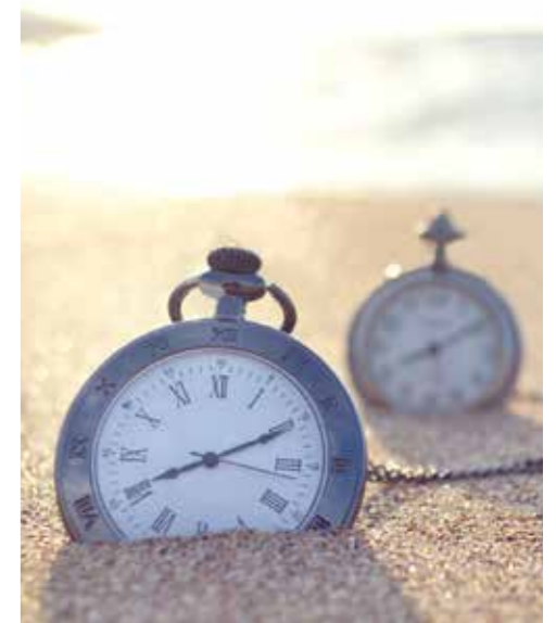
「日本の大和言葉を美しく話す」東邦出版 参照

過去から現在、そして未来へと続く「長い歳月の流れ」を、 深い感慨を込めて伝えたいときに。